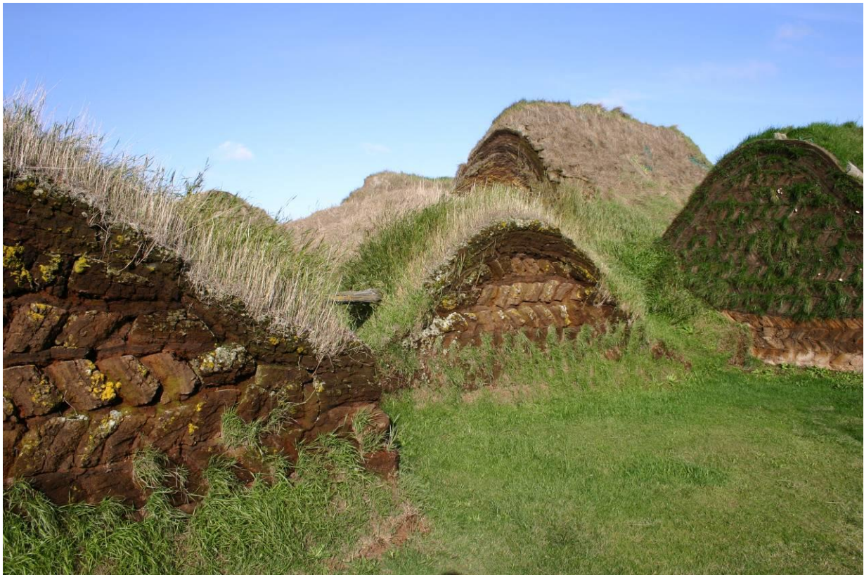
Glaumbær í Skagafirði, gaflhlöð. GLH 2007.

breytt í tæknirými og skemman er klædd að innan með krossvið. Millipil sunnan megin í bæjardyrum er klætt standpiljum en að norðanverðu er lárétt bordaklæðning felld inn á milli stöða og skástífa í grind. Suðurstofa er klædd brjóstþili með reitum að neðan og standpiljum að ofan. Yfir stofunni og bæjardyrum eru gólfborð suðurlofts á bitum. Stigi upp á loftið er við bakgafi suðurstofu og gengið í hann úr bæjargöngum. Suðurloft er klætt standþili og spjaldþili. Á húsinu eru kálfsperur, langbönd og reisifjöl. Norðurstofa er klædd spjaldþili og yfir henni er loft á bitum. Lokrekkja er innst í stofunni og afþiljaður stigi í suðvesturhorni. Norðurstofuloft er portbyggt, veggir klæddir standþili og spjaldþili og súðin klædd reisifjöl á langböndum og kálfsperum. Bæjargöng eru torfhláðin, stöðir eru við vegg og á þeim veggssyllur með þverbitum og á þeim er þakás og raftar yfir út á vegg.