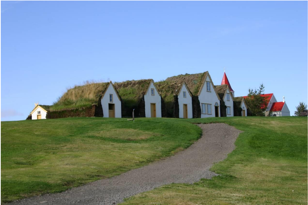
Glaumbær í Skagafirði. GLH 2007.